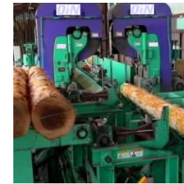
大径材用 ツインバンドソー