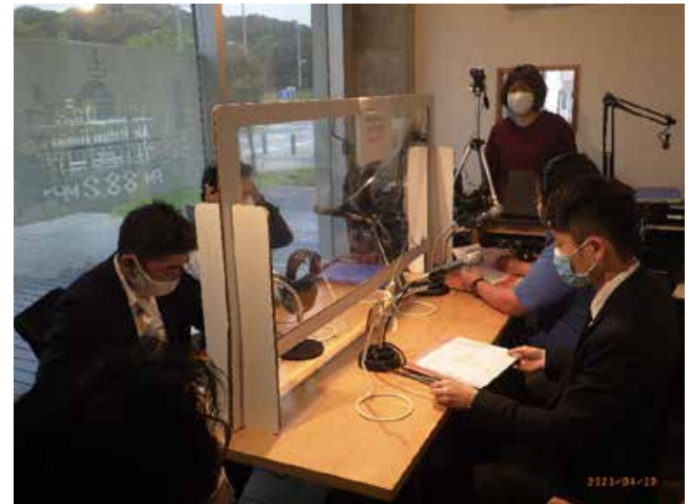
<FMラジオ番組「明日への扉」>