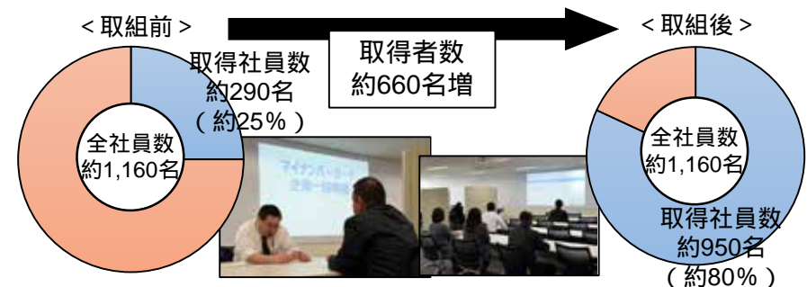
C社のマイナンバーカード取得状況