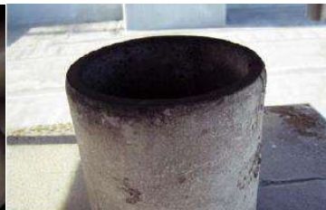
煙突の内側に使用 石綿含有断熱材