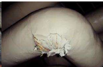
エルボ部に使用 石綿含有保温材