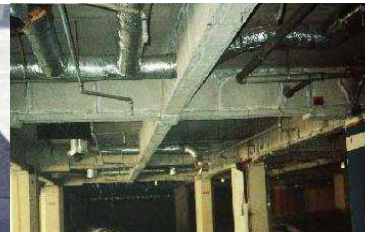
鉄骨を被覆して保護 石綿含有耐火被覆材