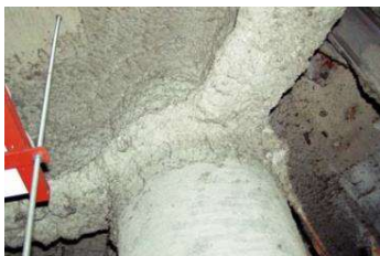
柱や梁に施工 吹付け石綿