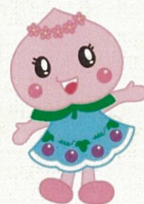
赤磐市マスコットキャラクター あかいわももちゃん

※当事業の、事業者説明会を令和3年12月22日に実施します。事業の概要説明、質疑応答等を予定していますので、募集要項をご確認のうえ、お申込みください。