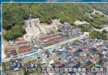
H26.8 広島土砂災害緊急事業 (広島県)