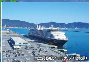
境港貨客船ターミナル (鳥取県)