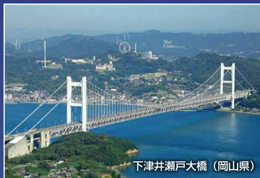
下津井瀬戸大橋 (岡山県)